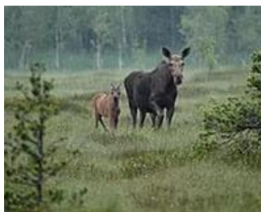
Лось на болоте