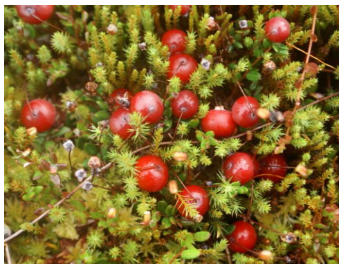
Клюква на болоте

Местные жители рассказали, что болото богато осенью ягодами клюквы, морошки. Местами растёт длинный лечебный мох-сфагнум. Зимой на снегу оставляют следы заяц, лось, рысь. В округе обитает дичь: рябчики, глухари, тетерева.